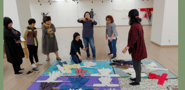
소곤당 지역 연구회 활동