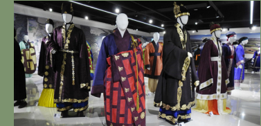
7세기 백제사리장 엄구 봉영 복식 재현전