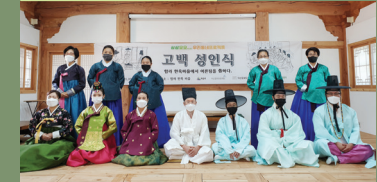
지역사회 전통한복 후원