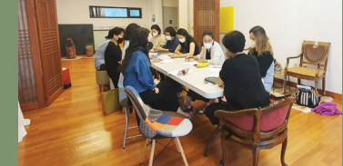
WDU 예정한복연구소 스터디