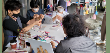
공예주간 전시 및 체험