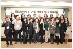
<10주년 기념 및 학술대회>